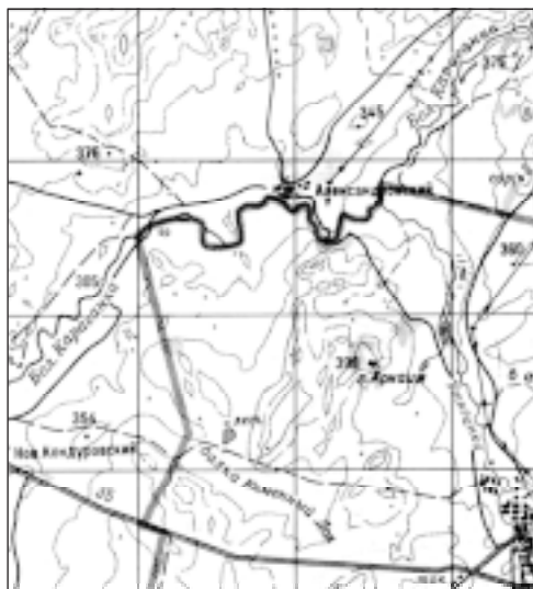
Аркайым тауы картала күрһәтелгән

Аркайым һымак торактар үзән йылғалары буйҙарындағы калкыулыктарҙа, тәбиғи сиктәр менән ситләнгән урындарҙа урынлашқан. Каласыктар йылға бөгөлдәре, әүәлге һыу юлдары, йырзалары, йәиһә махсус казылған каналдар менән