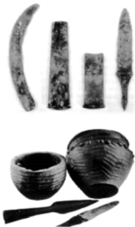
Бакырзан, бронзанан һәм балсыктан эшләнгән кәрәк-ярактар

Аркайымда көн күреүселәр төрлө кәсеп менән шөгөлләнгән. Төп шөгөлдәре — мал бағыу. Һөт, ит ашамлыктары әзерләгәндәр, тире иләгәндәр, һөйәктән көнкүреш кәрәк-ярактары яһағандар. Балсык көршәктәрзә йөндән һәм үсемлектәрзән һуғылған тукымаларзың эззәре һакланып калған. Айырыуса йылкысылыкка зур әһәмиәт бирелгән. Аттар кышын тибендә йөрөгән, мал әйзәүзә, йөк ташыуза, юл йөрөүзә, йорт-ерзә һаклауза, ике тәгәрмәсле арбаларға егеп, дошман менән алыштарзә файзаланылған. Төрлө токомло аттар үрсетеү, уларзы өйрәтеү, егеү нәмәләре, хәрби арбалар йылкысылыктың үсеше тураһында һөйләй. Каласык йәнәшендәге камалған биләмәлә мал-тыуар өсөн һыу яткылығы, лапащ һымак королмалар за булған. Хәүефле вақыттарзә куй-йылкыны ошонда кыуып индергәндәр.