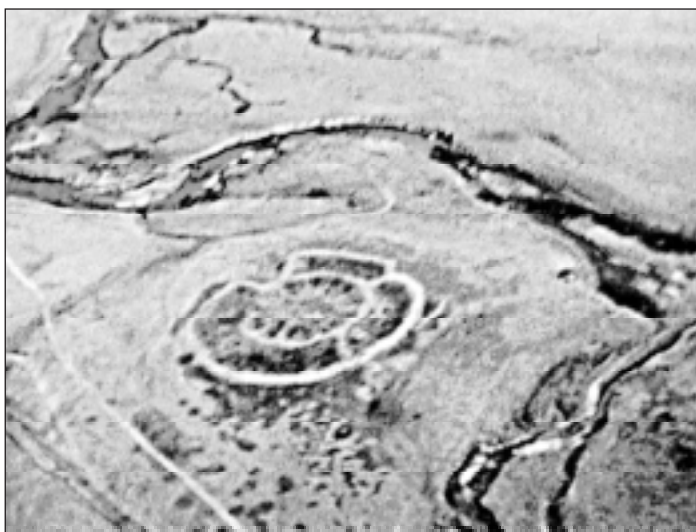
Аркайымдың күктән күренеше

Бик боронго замандарза Көнъяк Уралды һинд-европа, иң тәүзә һиндиран телдәре гаиләһенә караған халыктар, йәғни арийзар за тәйәк иткән. Уларзың көнитмеше тураһындағы матди сығанактарзы археологтар хәтһез йылдар буйы эзләне. Ниһайәт, 1987 йылдың йәйендә Урал таузарының көнсығыш битләүзәрәндә,