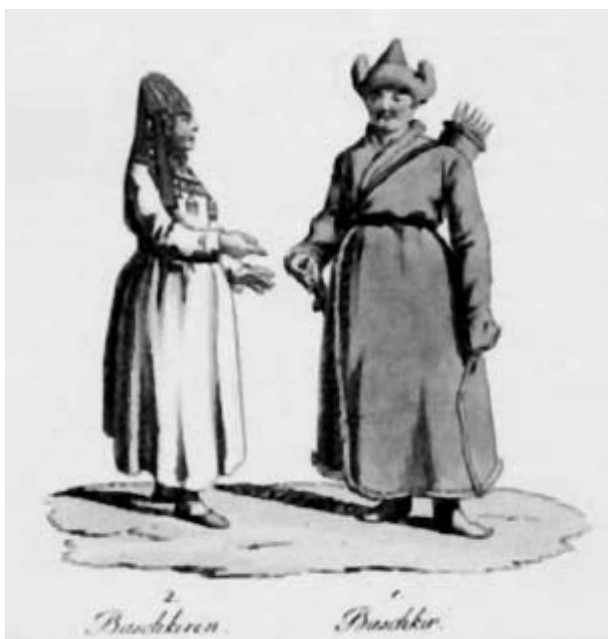
Башкиры. Акварель нем. худ. Х.-Г.Гейслера, участника экспедиции по югу России в 1793—1794 гг. ГМИИ им.Пушкина.

С добровольным вхождением Башкортостана в состав Русского государства фактически встретились два мира: кочевников и земледельческий. Конечно, башкирское мусульманское общество не могло немедленно ассимилироваться с православным русским. Процесс сближения с государственными институтами монархии, адаптации и интеграции башкир занял почти два века. Но русские уже в XVI веке развили и творчески применили Чингисхановскую форму взаимовыгодного сосуществования разных народов с разными религиями в одной стране — федерализацию. Что дало возможность юридически превратить Московское царство в евразийскую супердержаву.