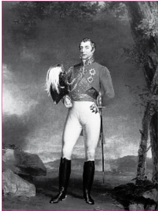
Веллингтон, герцог. Худ. Дж. Доу. 1820-е гг.

Французы, обескровленные постоянными войнами в течение двадцати лет, потерявшие в них самую пассионарную часть граждан, растеряли и пыл, возникший в революцию 1792 г. К тому же возникли разброд и шатания в умах — буржуазные слои были против войны, а часть регионов выступила вообще за королевскую власть Бурбонов. Это при том, что против них сложился единый фронт всей Европы. 8—9 (20—21) июня армии Веллингтона и Блюхера перешли границы Франции и начали быстрое продвижение к её столице. Чуть позже во Францию вступили воинские контингенты немецких княжеств и австрийцев. Академик Тарле Е.В. пишет: «После Ватерлоо немедленно во Францию вторглись армии: австрийская (230 тысяч человек), русская (250 тысяч человек), прусская (310 тысяч человек), английская (100 тысяч человек). Составляться эти армии начали с