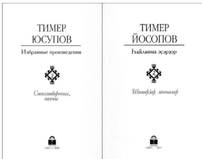
Т.Йосоповтың 2007 йылғы һайланма әсәрҙәр китабының титул бите

төрләнеү-һынылыштар аша тормош, донъя, йә камиллашып, йә зым-зия килеп, алға тәгәрәй. Ә шағирға “малайлык” кире кайтмаясаҡ. Ошо аҡыл-һабак йөрәкте кыса. Лириканың бөтә кәҙер-киммәте лә тәрән мәғәнәле уй-хистәрҙе уята алыуҙа түгелме ни? Ә “Тирәктәрәм төслө олоғаям шул, Индәрәмә кунмай һандуғас... Һуҙай аға икән ғүмерем. Әле генә таңдар аткайны бит, Алдарымда — шәфәк күмере” тигән юлдар “малайлыктан” “олоғайуға” күсәүгә бәйлә тыуған моңһоу