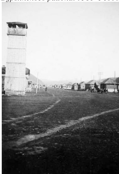
с. Старосубхангулово Бурзянского района. 1930-е годы

Горно-лесная зона Башкирской АССР относится к районам, в которых наряду с земледелием животноводство должно играть чрезвычайно большое значение. Более быстрые и высокие темпы роста поголовья, ликвидация бескоровности, внедрение овцеводства и свиноводства — вот современные проблемы животноводства. Устав сельскохозяйственной артели предусматривает для горно-лесной зоны Башкирии, к которой относится и Бурзянский район, в личном пользовании колхозника содержание 2—3 коров и, кроме того, молодняка; от двух до трех свиноматок с приплодом; от 20 до 25 овец и коз вместе; неограниченное количество птицы и кроликов, до двадцати ульев пчел.