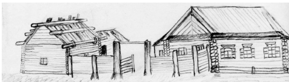
Дом жителя с.Старосубхангулово Бурзянского района Сабирьянова. 1930-е годы.

Супханкулово, за последние десять лет население увеличилось в четыре раза (с 227 чел. в 1926 г. до 991 чел. в 1936 г.). Сильно изменился и общий вид деревни. Большая половина поселка состоит из новых деревянных зданий, специально построенных, советских и культурных учреждений: райсовета, клуба, школы, аптеки, кооператива и т.д., а также 2-квартирных домов для населения. На горе видны корпуса новой больницы. Возведены колхозные постройки. Имеется паровая мельница и электричество. Целый день слышится стук топоров, скрип подвод, привозящих строительные материалы. К зиме спешат закончить еще несколько зданий. Всё говорит о том, что строительство идет здесь неослабевающим темпом.