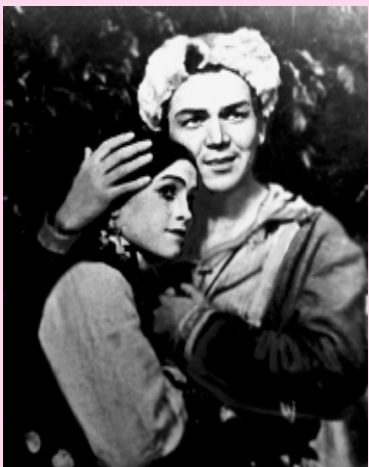
Арыслан Мөбәрәков менән сәхнәлә

Бына шулай. Был осракта, кем әйтмешләй, комментарий кәрәк түгел. Һәр хәлдә, ошо декаданан Арыслан Мөбәрәков — СССР-зың халык, Рәғизә Янбулатова РСФСР-зың атказанған артистары тигән оло исем күтәрәп кайталар.