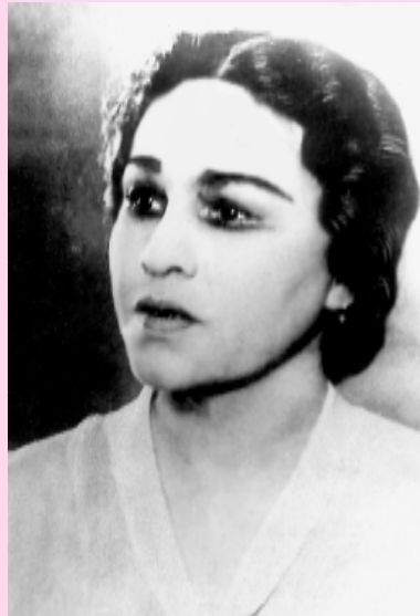
Рәғизә Сәйетғәли кызы Янбулатова

Рәғизә Янбулатова... Әгәр исән булса, әле уңа 90 йәш тулыр ине. Исем-шәрифә ишетер колакка моңло йыр кеүек яңгыраған ошо шәхес хакындағы язмаларҙы, иҫтәлек-хәтирәләргә актарған һайын мин уның образына нығыраҡ ҙашик булдым. Уның иҫенә төшкән йөктәргә барлаган, белгән һайын ул минең каршыма нескә хисле лирик пландағы актрисанан, кеше күңеленең иң нескә кылдарына казылыр шағирәнән кырыс, ләкин, нисек кенә асы булмаһын, дөрөслөктө ярып алдыңа һалыр драматургка, һуңғы һулышына тиклем башикорт театр сәнғәтенең һыулаузарын, тимәк, токомдаштарының рухи именлеген кайғыртыр илаһи затка әүерелде. РСФСР-ҙың атказанған һәм Башкортостандың халык артисткаһы Рәғизә Сәйетғәли кызы Янбулатова хакында сәхнәлә уның уйнағанын күрөп белмәгән быуыңға һиндәй тел менән, нисек һөйләргә? Хәкикәткә зарар итмәйенсә, башикорт иле өсөн кәҙерле йән эйәһенә — сәхнә котона — әүерелгән был сәнғәт алиһәһе тураһындағы язмаларымды кайҙан, һизән башиларға? Ғәҙәттә без, яҙыусы халқы, үзебезҙең ижади кухняны укыусыға асып һалып бармайбыз. Йәнәһе лә язмаларыбыз — очеркмы ул, хикәйәме — Илаһи көстөң кушыуы менән тыуып, ак кағыз биттәренә тулып: "Инде мине укыһағыз за була!" — тип яр һалып кысқырып, укыусы алдына килеп ята. Юк. Катмарлы, йөз йылға бер тыуар язьмыштар хакында яҙыу еңел түгел. Бына әле лә, һисәмә көндәр уйланып, һыҙланып йөрөгәндән һуң, мин Рәғизә исемле, шаңлы, даулы тормош юлы үткән шәхес хакындағы язмаларымды укыусы хөкөмөнә тапшырырға йөрәт иттем.