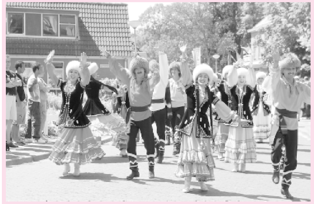
"Опроклдайс—2006" фестивален асыу тантананы

Фестивалдә төрлө китғаларзан килгән коллективтарзы күргәс, тәүзә бик борсоллоп та алдык. Бөтәһенәң дә хореографияһы, музыкаһы көслә — без уларға тинләшә алырбызмы, тигән уйзар борсоно. Сығыш яһай башлағайнык, безгә күберәк кул сабалар, игтибар за арта. "Башкирия — супер! Колоссалль!" тигән һүззәр ишетәбөз. Урамдарға сығһак, халык һырып ала, бейеүселәр менән фотоға төшә. Айырыуса үззәренә безнең